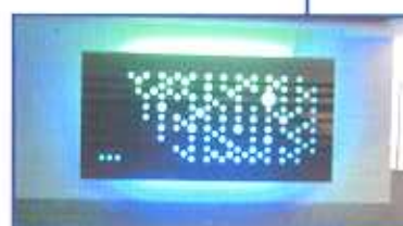
3. Preis „Käsekunst im Querformat“ Technische Oberschule Stuttgart