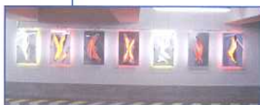
3. Preis „Durchbruch des Lichts“ Technische Oberschule Stuttgart