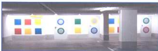
Bester Entwurf der Schule „Quadrate und Kreise“ Königin-Katharina Stift