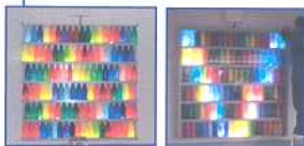
1. Preis „Flaschenlichtspiel“ Evangelisches Heidehof Gymnasium