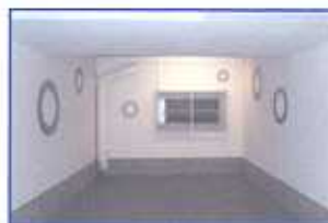
„Silberzimmer“ Königin-Katharina Stift